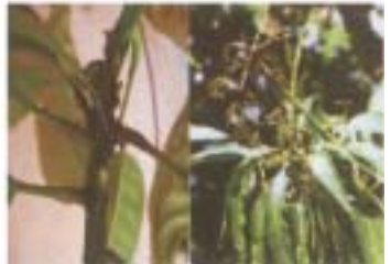
తేనెమంచు పురుగుతో దెబ్బతిన్న రెమ్మ, పూగుచ్చం

తల్లి పురుగులు, పిల్ల పురుగులు గుంపులుగా చేరి లేత ఆకులు, పుష్పగుచ్చాలు, పూలు మరియు పిందెల నుండి రసాన్ని పీల్చుతాయి. దీనివలన పూత, పిందె వాడి రాలిపోతాయి. అంతేకాకుండా ఈ పురుగులు విసర్జించిన తేనె లాంటి తియ్యని పదార్థంపై మసి