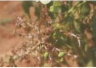
బూడిదతెగులు ఆశించిన పూగుచ్చము

చల్లని రాత్రులు మరియు వేడి పగటి వాతావరణంలో పూత మరియు పిందెపై తెల్లని పొడి లాంటి బూజు ఏర్పడుతుంది. ఈ శిలీంధ్రము ఆశించుట వలన పూలు, పిందెలు రాలిపోతాయి. నివారణ : నీటిలో కరిగే గంధకము 3 గ్రా. లేక ట్రైడిమార్ఫ్ లేదా డినోకాప్ 1 మి.లీ. లేదా హెక్సాక్సోనాజోల్ 2 మి.లీ. లీటరు నీటికి కలిపి పిచికారి చేయాలి.