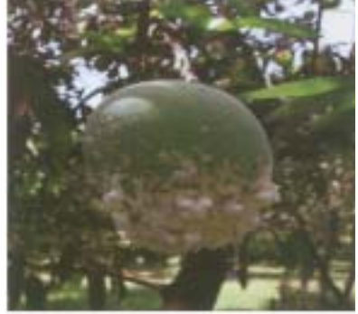
పిండినల్లి ఆశించిన కాయ

భూమిలో పొదగబడిన గ్రుడ్ల నుండి వచ్చిన పిల్ల పురుగులు చెట్లపైకి ప్రాకి లేదా చీమల ద్వారా లేత కాయలపై మరియు కాడలపై చేరుతాయి. ఈ పురుగులు లేత రెమ్మలు, కాయలు, తొడిమలపై గుంపులుగా చేరి రసాన్ని పీల్చి నష్టపరుస్తాయి. ఇవి వినర్షించిన తియ్యని పదార్థంపై నల్లని మసి మంగు ఏర్పడడానికి కారణమైన శిలీంధ్రాలు పెరుగుతాయి. వీటి తీవ్రత