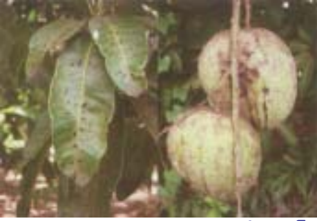
ఆకులపై మరియు కాయలపై బ్యాక్టీరియల్ నల్లమచ్చ తెగులు

బ్యాక్టీరియల్ నల్లమచ్చ తెగులు : ( Xanthomonas compestris p.v. mangiferae indicae )