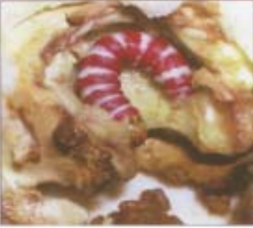
కాయల తొలుచు పురుగు

ఈ పురుగు పిందె దశ నుండి కాయ పెరిగే దశ వరకు, కాయ నాశించి విపరీతంగా నష్టం చేస్తాయి. కాయ కొన భాగంలో రంధ్రం చేసుకొని కాయలోపలి జీడిలో పెరుగుతాయి. కాయలు రాలిపోతాయి.