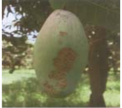
తామర పురుగుతో కాయపై తామర పొలుసు

ఇవి 2 మి.మీ. పొడవుండి, కొత్తచిగురు వచ్చే దశలో ఆకులపై అసంఖ్యాకంగా చేరి గోకి రసాన్ని పీల్చివేస్తాయి. దీనివలన చిగురు ఆకులు చిన్నవిగా ఉండి ఆ తరువాత రాలిపోతాయి. ఈ తామర పురుగులు పుష్పగుచ్చములపై, పిందెలపై చర్మం గీకి రసం పీల్చడం వలన వక్క రంగులో చర్మం బీటలు వారి రాతి మంగు ఏర్పడి, కాయ నాణ్యత పడిపోతుంది.